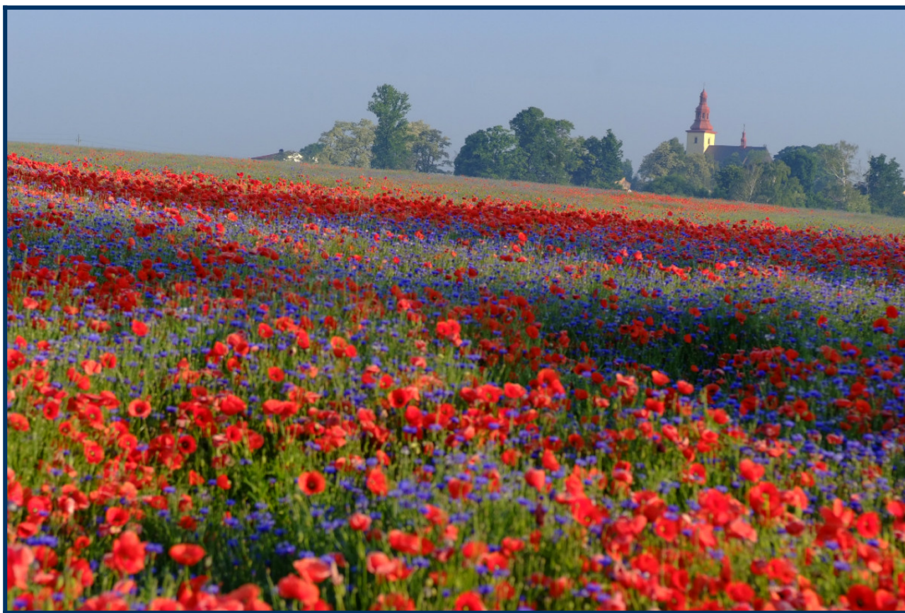
Łąka na terenie Gminy Poraj