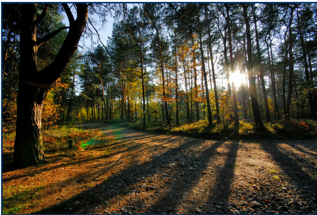
Las na terenie Gminy Poraj (sołectwo Masłońskie)