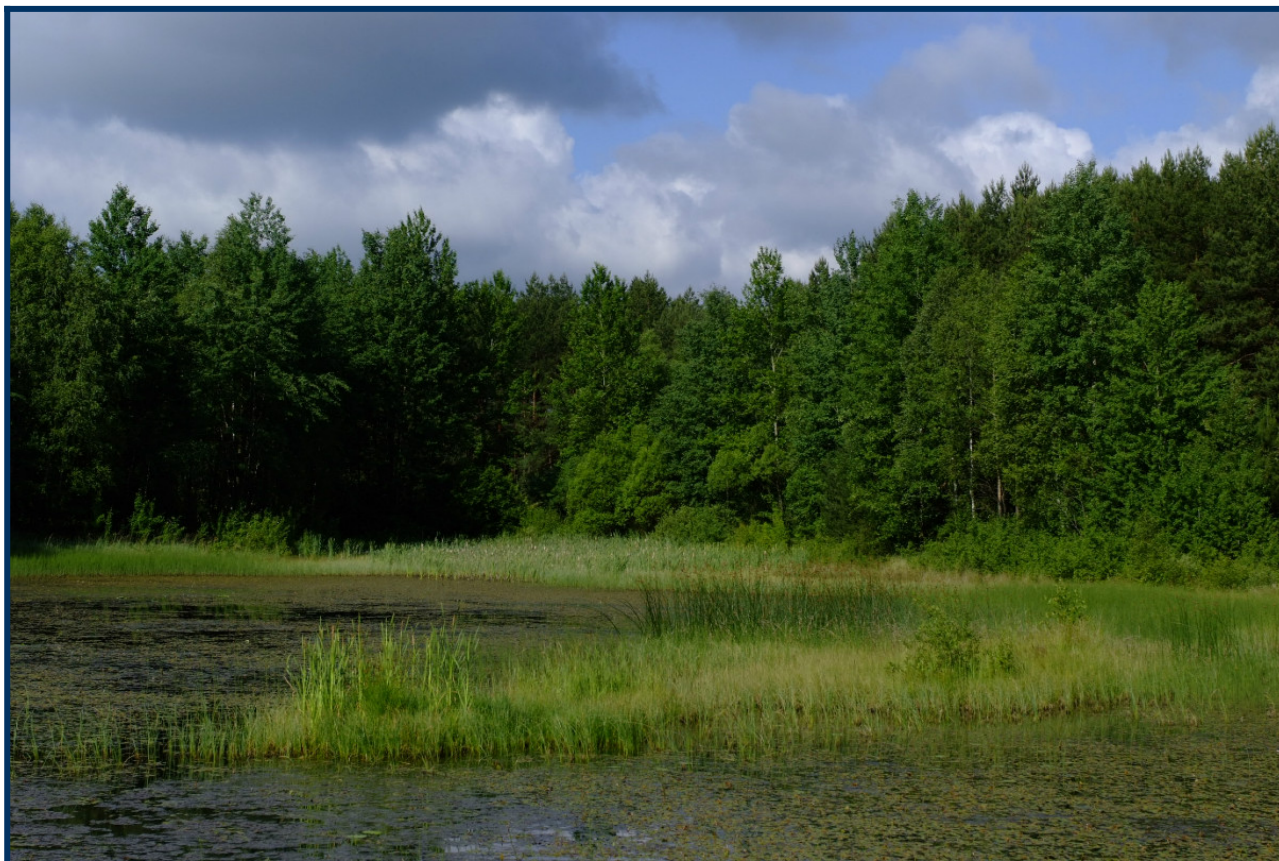
Roślinność nad Zalewem Porajskim

Na powierzchni wód stojących i wolno płynących tworzą się skupiska rzęś ( Lemna, Spirodela ). Brzegi wód i okresowe rozlewiska zajmują zbiorowiska roślin jednorocznych (z klasy Bidentetea tripartiti ) z uczepem ( Bidens cernuus ), jaskrem jadowitym ( Ranunculus sceleratus ) i inne.